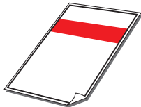
〈 사용 설명서 〉